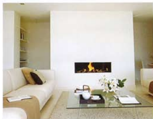
CHIMENEA. Un volumen geométrico contiene la chimenea y limita la zona de estar. Las paredes de toda la casa se han acabado con estuco blanco.

triángulo, no sólo constituyó un motivo de inspiración, sino que también le permitió crear este particular triedro, cuyo frente imponente, en oposición al punto de fuga de la parte posterior de la casa, semisumergida y apenas construida, se erige como un viga de la bahía.