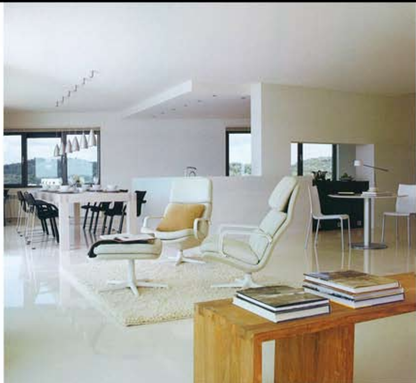
ZONA DE LECTURA Y DE TRABAJO. Banco de teaca Cubo, de Ethnicraft, en Aquitania. Dos butacas, de Artfort. En la zona de trabajo, la mesa Zero, de Jesús Gasca para Stuar; las sillas Eva, de Erresse Studio para Bontempi, y la lámpara Bo-Ha, de Metalarte. Todo, en Blanc.