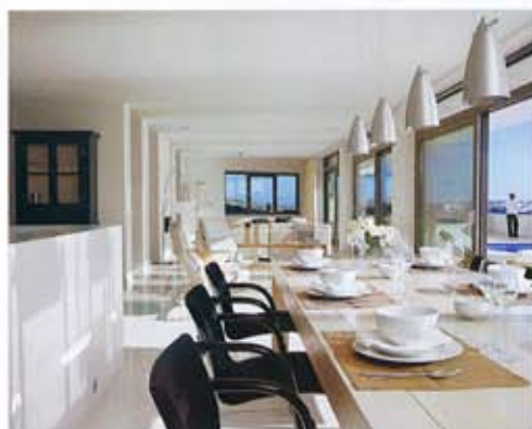
PERSPECTIVA. La mesa es de roble tintado de color blanco-gris. Sillas S320, diseño de Ulrich Bohme para Thonet. Lámparas Gothic Allu, de Deltalight.

Faedo añade que el extraordinario tratamiento formal de la casa fue posible no sólo gracias a la complicidad con el cliente y la particularidad del terreno, sino también a la aportación del constructor, especializado en la ejecución de obras de hormigón complejas. Esto le permitió concebir esas balconadas y voladizos de dimensiones casi sobrenaturales, que parecen flotar en el aire y protegen la casa, encajada dentro de esa suerte de caja triangular. "Al ver sacar el encofrado de balcones y terrazas, senti que veía algo mágico, no sólo por las dimensiones de los volúmenes en voladizo, sino también porque los acabados y el blanco del hormigón parecían hechos directamente en yeso", comenta el arquitecto.