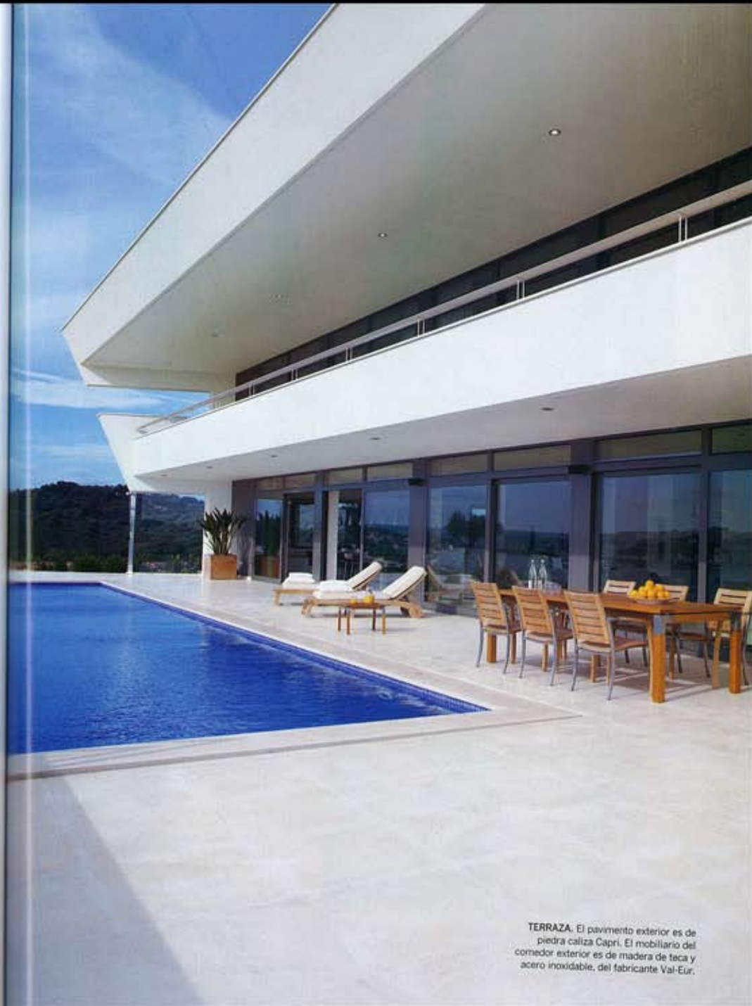
TERRAZA. El pavimento exterior es de piedra caliza Capri. El mobiliario del comedor exterior es de madera de teca y acero inoxidable, del fabricante Val-Eur.

Para empezar, el cliente le dio carta blanca para que utilizara su imaginación con total libertad. "Solo aclaró que no quería nada rural o tradicional -puntualiza Faedo-. También hablamos de su entusiasmo por la música de Bach y por la arquitectura moderna, lo que no necesariamente quiere decir actual". Por otra parte, el arquitecto destacó que la forma triangular del terreno, que desciende de norte a sur, y cuya parte más elevada conforma el ángulo más estrecho del ▶