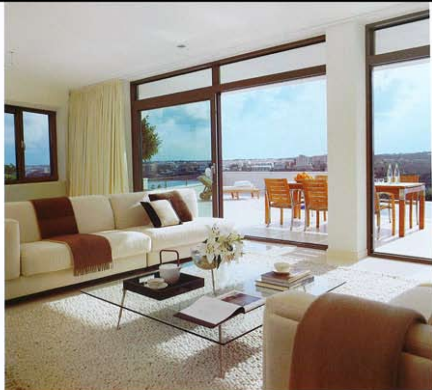
VISTAS. Los amplios ventanales permiten disfrutar de las vistas desde el estar. Sobre los sofás, de Gelderland, dos mantas de cachemira, de Teixidors, en Aquitania, y cojines de piel, de L'Antique Colonial. Mesa de centro, de Gehard. Juego de té, de Villeroy & Boch, en Blanc.