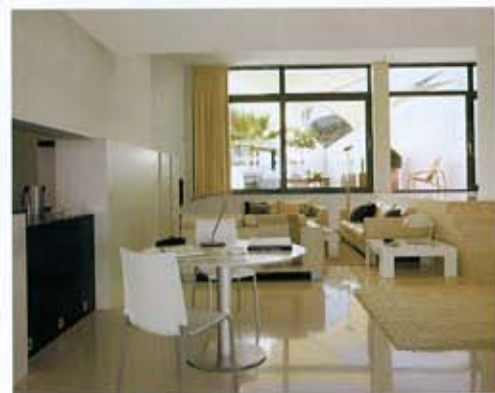
PATIO INTERIOR. En la fachada posterior de la casa, un gran ventanal ofrece una amplia visión del patio interior y crea una iluminación natural cruzada.

horadados para que cada estancia de la casa esté en comunicación con el paisaje, "uno orientado a saliente y otro a poniente, de manera que a través de ellos penetra el alba y también el crepúsculo", dice el arquitecto. El patio, orientado al norte, constituye un rincón sombreado para los soleados días de verano; aunque también es el vértice desde el que la casa se proyecta. La topografía del terreno permitió que el patio quedara en un plano más elevado, y que, a su vez, el salón tuviera una doble altura. Este último espacio ocupa, junto con el comedor, la parte central de la planta baja.