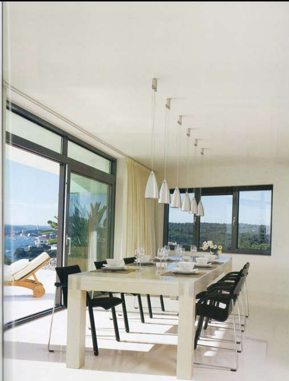
SERVICIO DE MESA. Individuales de hilo, de Kardelen, en Aquitania. Vajilla y cristalería, de Ikea. Botes de porcelana, modelo Asari, de Thomas, en Blanc.

La generosidad del frente, abierto y voluminoso, se equilibra con el tratamiento de los laterales, compuestos por muros más herméticos, suavemente ▶