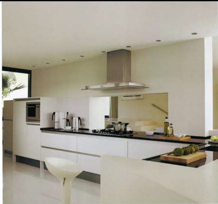
COCINA. El mobiliario es de la firma Siematic. La encimera, de granito negro de Suráfrica, en Mármoles S'Olivera. Campana extractora, de Atag; horno, microondas y frigorífico, de Siemens. Placa de cocción Ceran, de Miele. Taburete, modelo Bonibo, del fabricante Magis.