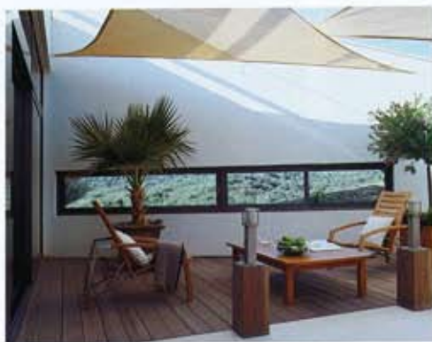
ZONA DE SOMBRA. Unas velas de algodón crean una acogedora zona de sombra. Los dos sillones y la mesa, de teca y acero, son de Val-Eur.