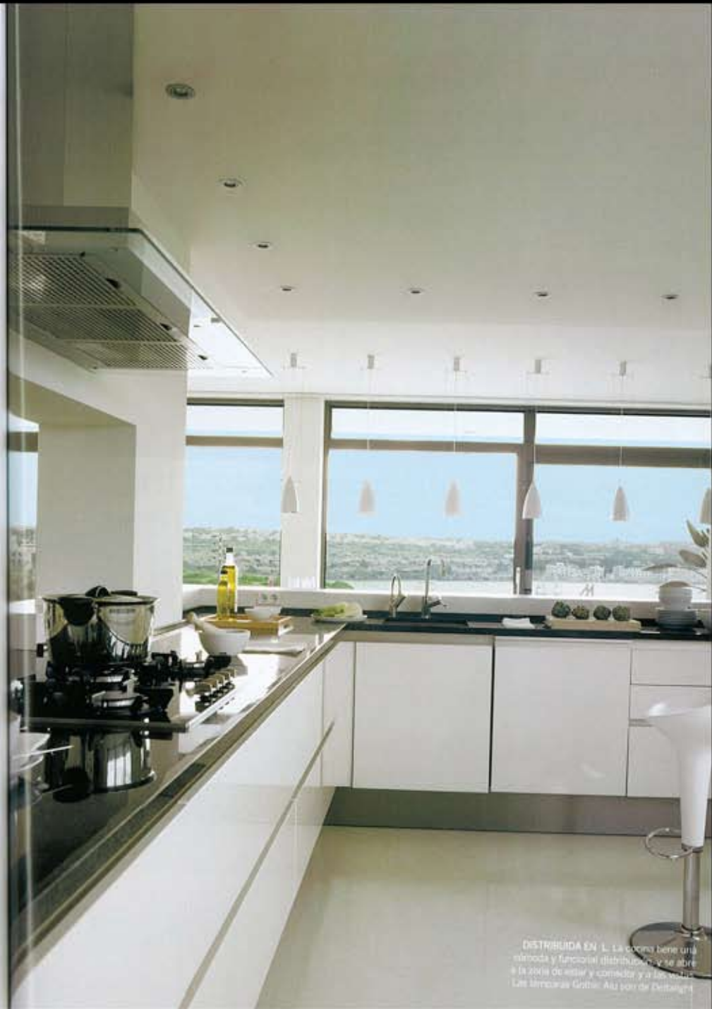
DISTRIBUIDA EN L. La cocina tiene una distribución y funcionalidad que se abre a la zona de estar y comedor y a los muebles. Las sillas son de Debonair.