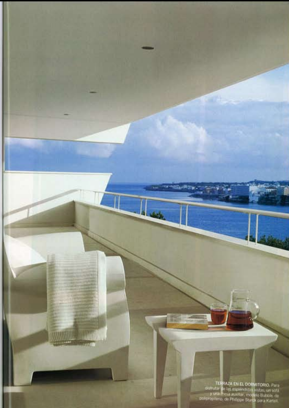
TERRAZA EN EL DORMITORIO. Para disfrutar de las espléndidas vistas, un sofá y una mesa auxiliar, modelo Bubble, de polipropileno, de Philippe Starck para Kartell.