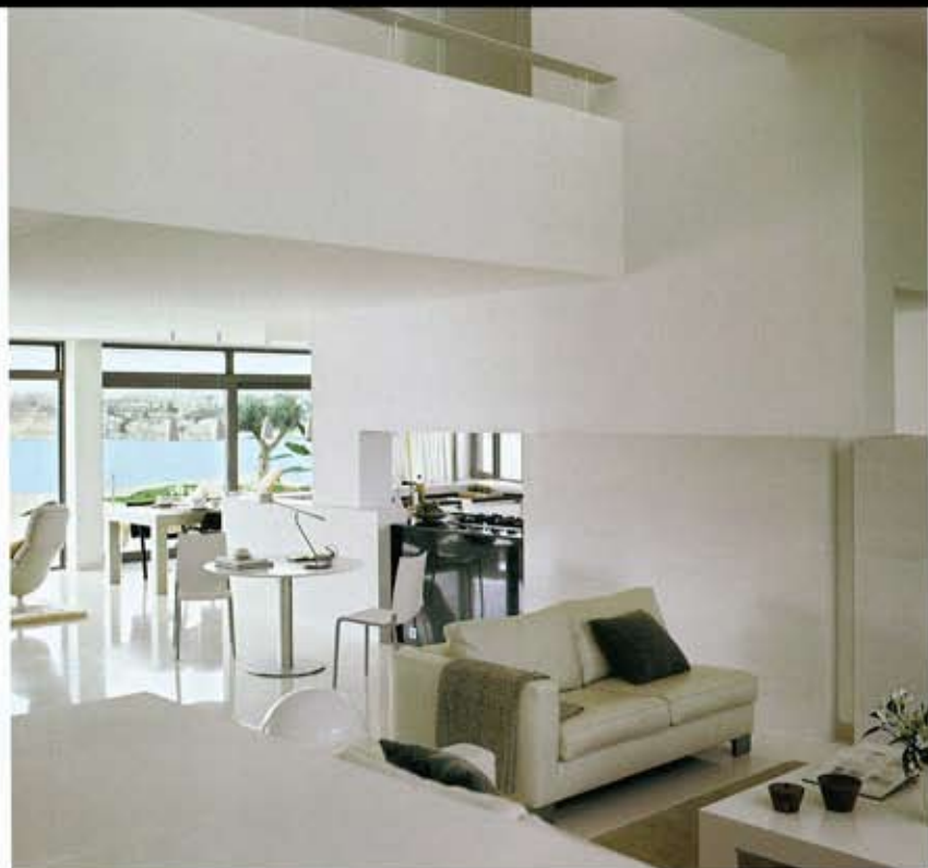
CONTINUIDAD ESPACIAL. La zona de día integra varios usos que quedan configurados por el mobiliario y se comunican abiertamente. El comedor se sitúa en paralelo a la cocina, que se abre, mediante un hueco en el tabique, a una salita orientada hacia el patio interior.