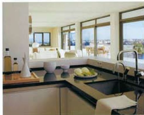
ABIERTA AL ESTAR. Grifería Vola, de latón y acero inoxidable modelo KV1. Aceitera de porcelana Antigoteo, de Pordansa, y bandeja de haya, en Blanc.

de L. posee un aire espacioso y funcional, acentuado por el hecho de estar abierta, por un lado, al espacio común que comparten el salón y el comedor, y por otro, a la sucesión de ventanas que acercan las vistas del exterior. En la planta superior se ubican cuatro dormitorios, dispuestos frente al extraordinario balcón corrido. Desde ellos, se puede acceder a la terraza del lado norte de la vivienda, que da sobre el patio, y a la doble altura que se vuelca sobre el salón. La planta subterránea no sólo alberga la zona de servicios y el garaje, sino que cuenta, además, con un depósito para almacenar y filtrar el agua de lluvia, y con una bodega de vinos perfectamente acondicionada.