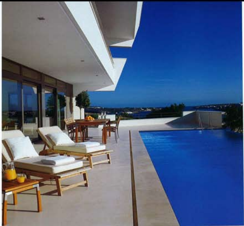
PISCINA. Junto a la piscina, revestida con teselas de gresite de color azul, se han dispuesto varias tumbonas, de madera de teca, adquiridas en Es Bosc. La mesa auxiliar, de madera de teca y acero inoxidable, es del fabricante Val-Eur. Las toallas son de Textura.