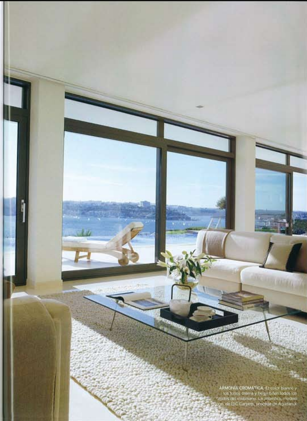
ARMONÍA CROMÁTICA. El color blanco y los tonos crema y beige llenan todos los frentes del mobiliario. La alfombra, modelo Storm, de BIC Carpets, procede de Aquitania.

"No creo en la idea de una arquitectura que se integre en la naturaleza –prosigue el autor del proyecto–; que haga desaparecer los límites entre lo 'humano' –lo construido– y lo 'divino' –lo natural–. Quizá son los tópicos sociológicos y ambientales los que impiden entender que entre lo edificado por el hombre y lo natural no existe posibilidad de integración, y de algún modo es asumir la imposibilidad humana de configurar o modelar un todo. Creo que, en este contexto, la verdadera función del arquitecto es la de dar forma a las tensiones que se generan entre la naturaleza y la obra", concluye. ▶