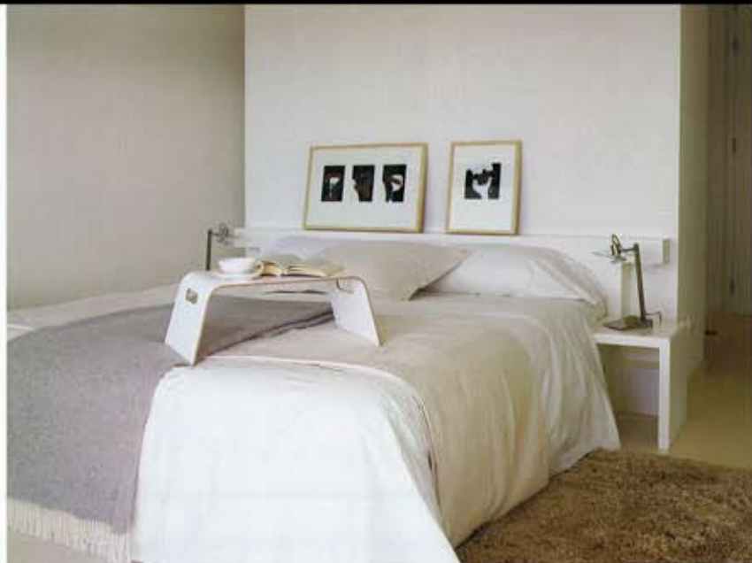
DORMITORIO. La cama y las mesitas son del fabricante Auping. Funda nórdica Garza, de Cantori, en Aquitania. Cocha de algodón, en color crudo, en Es Bosc. Plaid de terciopelo, de Gastón y Daniela, en Platero Decoración. Fotografías de Lluís Real en la Galeria Artara.