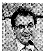
ARTUR MAS presidente de la Generalitat